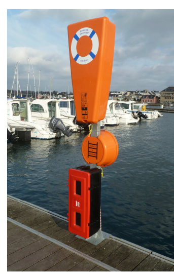
Echelle de secours montée sur ½ poteau bas