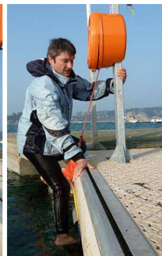
1 : tirer sur le cordage